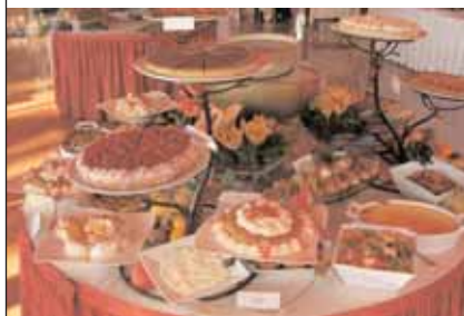
LE BRUNCH TRADITION

Au Carlton Salon : « Le brunch tradition », le dimanche de 12h à 14h30 (55€ par personne, vin, eau et café compris, gratuité enfant - jusqu'à 12 ans, 1 enfant par adulte).