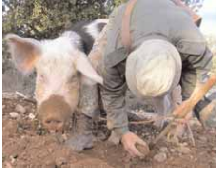
DÉMONSTRATION DE CAVAGE AVEC UN COCHON

♦ Fête de la truffe de Haute Provence à Forcalquier, les 7 et 8 février