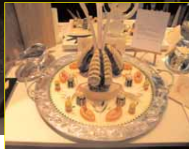
LE PLAT DE PIERRE KOCH