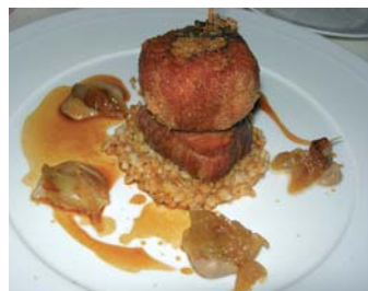
Pojarski de veau, étuvé dans un lait de rose aux truffes d'été, petit épeautre et oignons glacés