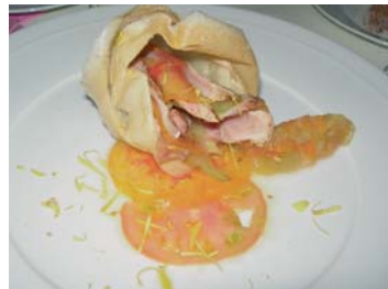
Pétales de thon et d'espardon marinés, sur confit de tomates vertes et jaunes

• Villa Belrose****L Boulevard des Crêtes à Gassin. Tél. (0)4 94 55 97 97 http://www.villabelrose.com Menu rose 115€ par personne