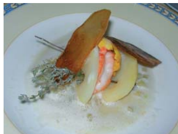
Médailles de homard et pommes des sables dans un bouillon très rose, très Sud