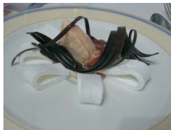
Rose illusion autour d'une glace et d'une guimauve