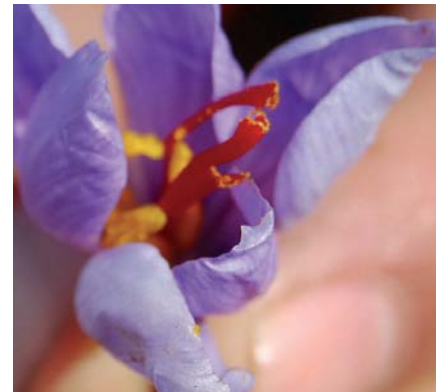
Le dernier crocus cueilli le 27 novembre 2007