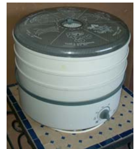
Séchoir à pistils