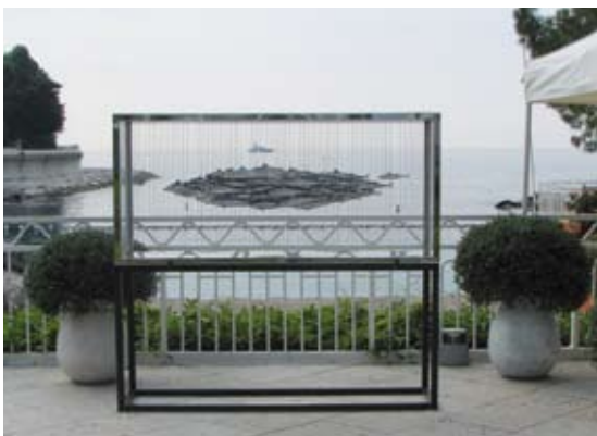
LE « BANC DE POISSONS »

Jusqu'à la fin du mois d'août, Le Méridien Beach Plaza et Opéra Gallery Monaco vous invitent à découvrir une nouvelle perspective sur la sculpture avec deux œuvres inédites de l'artiste français Mauro Corda.