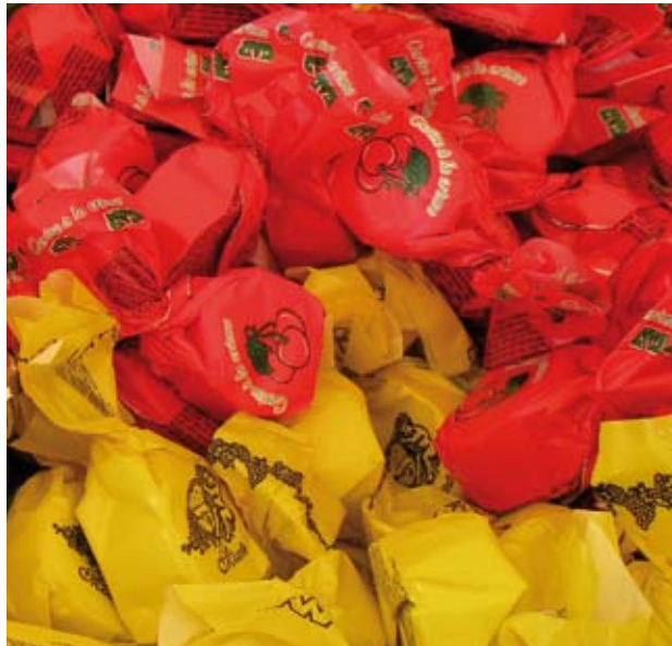
LES «CUNEESI», LES FAMEUX CHOCOLATS FOURRÉS À LA LIQUEUR, SPÉCIALITÉ LOCALE DE CUNÉO

■ L'ITALIE À TABLE Jardin Albert I er - Place Masséna Du 2 au 5 juin http://www.italieatable.fr