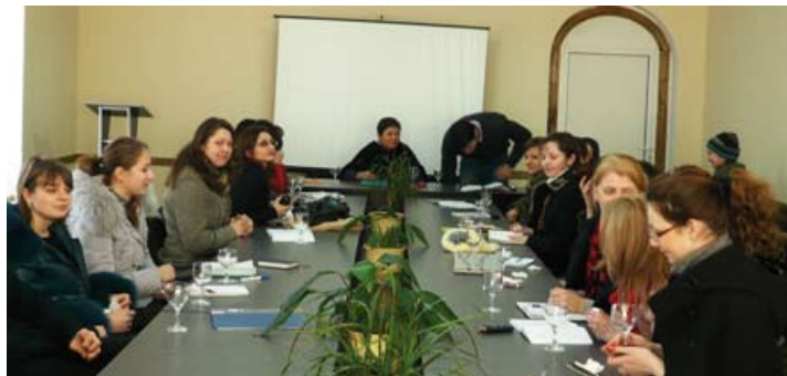
UNE MASTER CLASS AVAIT ÉTÉ ORGANISÉE À CHISINAU EN FÉVRIER 2010, LORS D'UN PREMIER CONTACT AVEC DE FUTURS SOMMELIERS

Depuis 2 ans, l'association des sommeliers d'Europe (ASE) travaille en étroite collaboration avec l'association des sommeliers de la république de Moldavie.