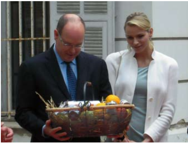
LE PRINCE ALBERT II DE MONACO ET CHARLENE WITTSTOCK