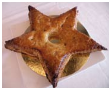
LA GALETTE DES ROIS