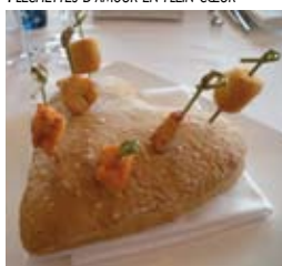
FLÉCHETTES D'AMOUR EN PLEIN CŒUR