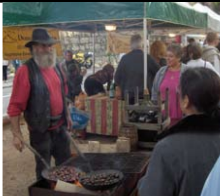
CHÂTAIGNES GRILLÉES SUR LA PLACE DU JEU DE BOULE

• Du 12 décembre 2009 au 3 janvier 2010 Office de tourisme de Saint-Paul de Vence 2, rue Grande Tél. (0)4 93 32 86 95