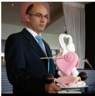
CUPIDON AUTOUR DU CHOCOLAT