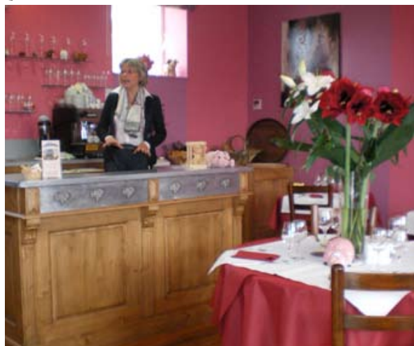
SALLE DE DÉGUSTATION CHEZ BOBOSSE

• Les rendez-vous de Bobosse Rond-point « la porte du Beaujolais » 957, avenue de l'Europe - St Jean d'Ardières 69220 Belleville-sur-Saône Tél. (0)4 37 55 02 74 lesrendezvousdebobosse@orange.fr http://www.bobosse.fr