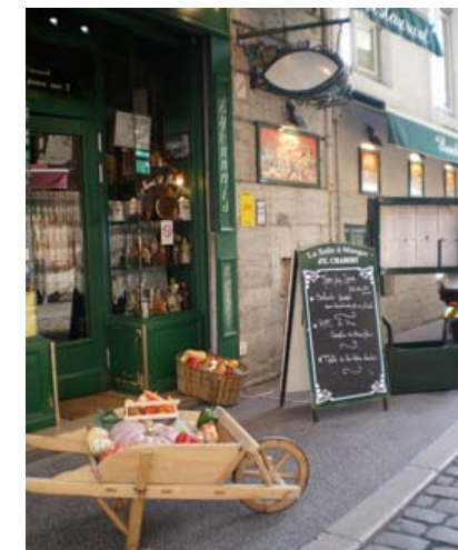
RESTAURANT CHABERT, RUE DES MARRONNIERS À LYON

Au bout de la rue, à deux pas de la fameuse place Bellecour, une vitrine étonnante, celle de la pâtisserie Perroudou. Des tuiles géantes à tous les parfums... à croquer à plusieurs.