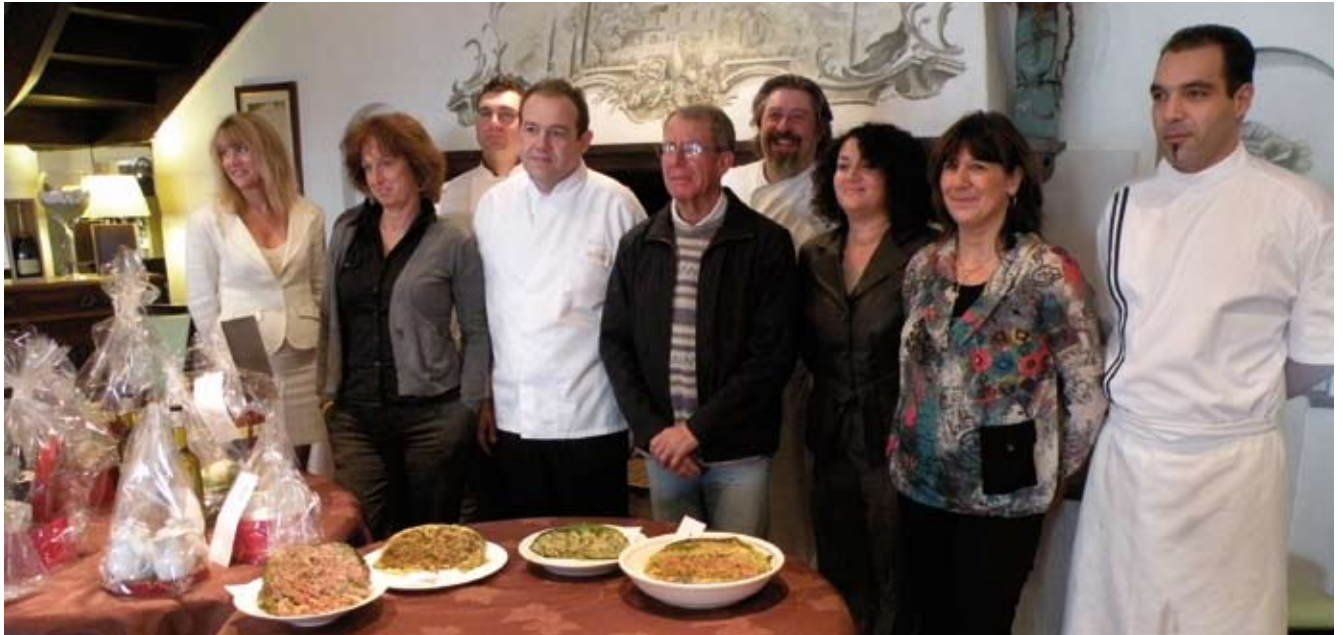
LES CANDIDATES ET LES CHEFS