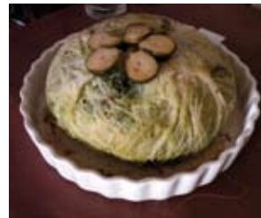
LE FASSUM DE MME BOSELLI

• Lou Fassum 381, route de Plascassier 06130 Grasse Tél. (0)4 93 60 14 44 http://www.loufassum.com