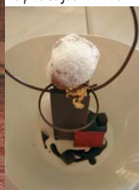
Le dessert de Jocelyn Ballat