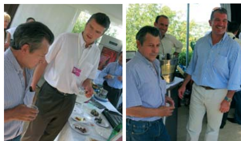
Jacques Maximin sur le stand des foies gras « Lafitte » et du champagne « Laurent-Perrier », champagne exclusif du festival