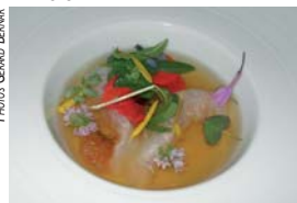
Langoustines, bouillon Dashi Mauro Colagreco