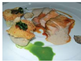
Côte de veau rôtie Keisuke Matsushima