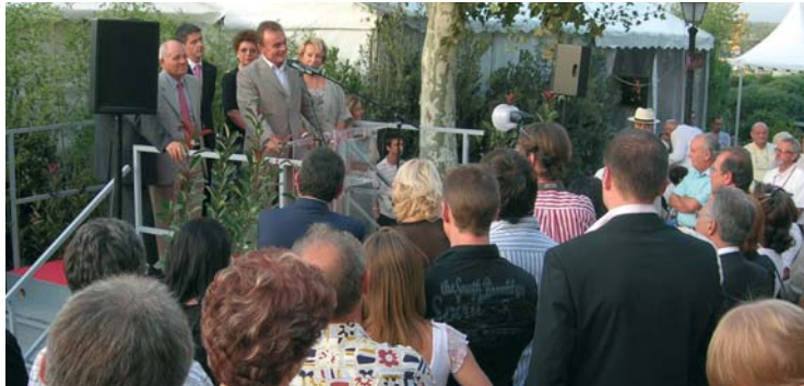
Le maire de la ville, Richard Galy, inaugure la seconde édition des « Étoiles de Mougins »