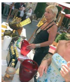
« La Petite Tuilière »